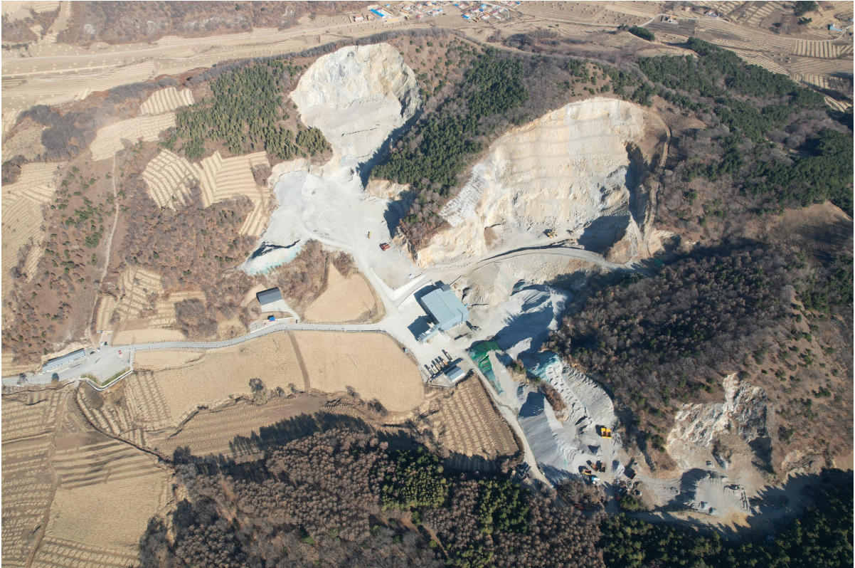
图 2-1 项目区地形地貌