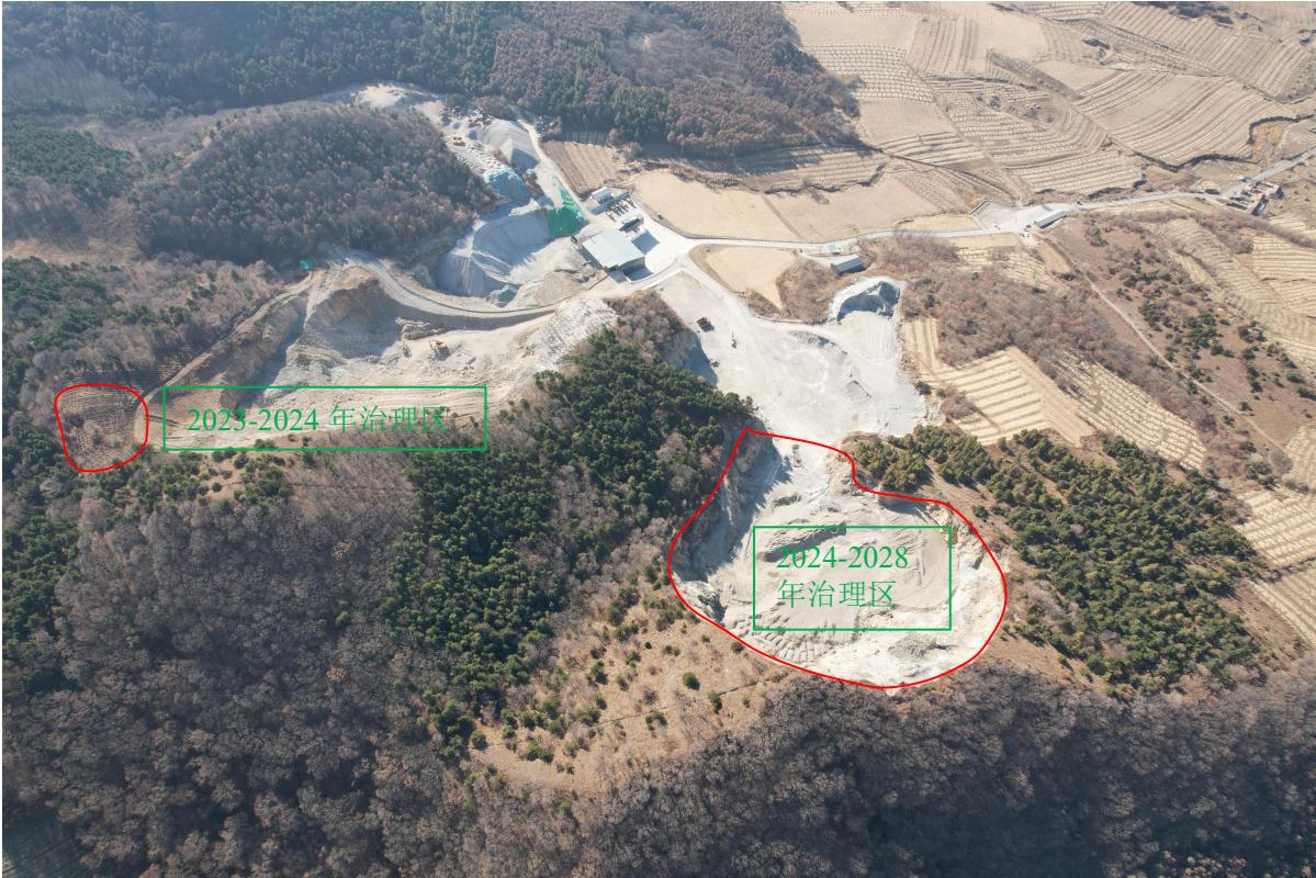
图 6-1 土地复垦年度治理计划平面示意图