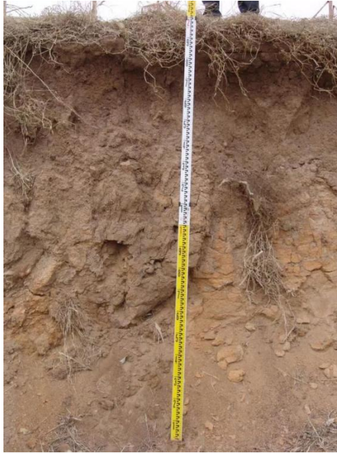
图 2-3 项目区土壤