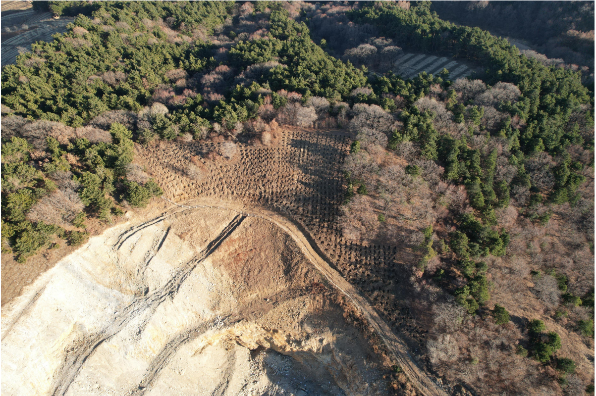
图 2-2 项目区植被