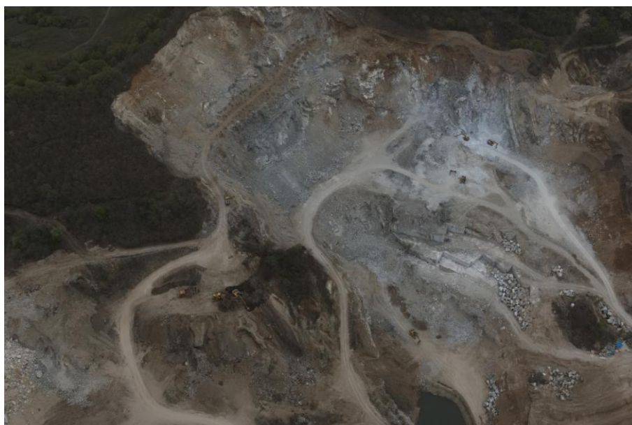
图 3-5 四采区采场