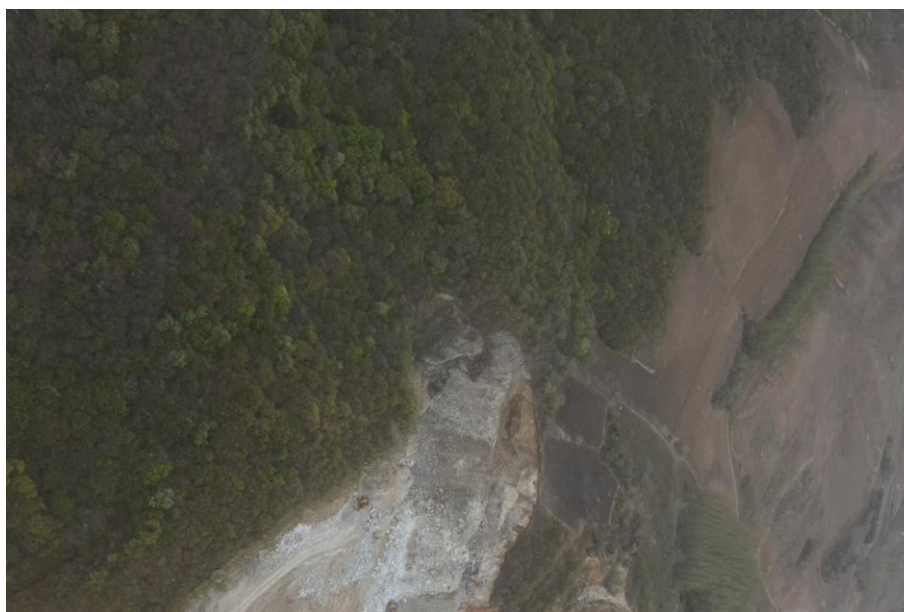
图 2-2 矿区植被图

矿区所在地在植被区划上位于暖温带落叶阔叶林区和温带针阔混交林区交汇处，森林植物种类比较丰富，树木种类以阔叶，落叶树为主。矿区地表植被较发育，多见松树、柞树、榛子等林木。植被覆盖率大于 80%。