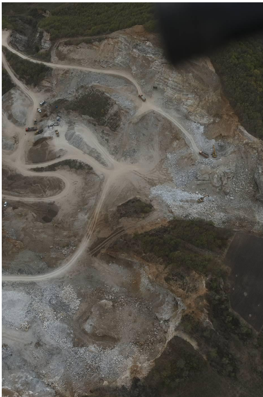
图 3-3 一、二采区采场

现状条件下露天采场总挖损面积 6.06hm 2 。损毁土地类型为乔木林地、其他林地、采矿用地和农村道路，土地权属为泉头镇农林村，见图 3-3。