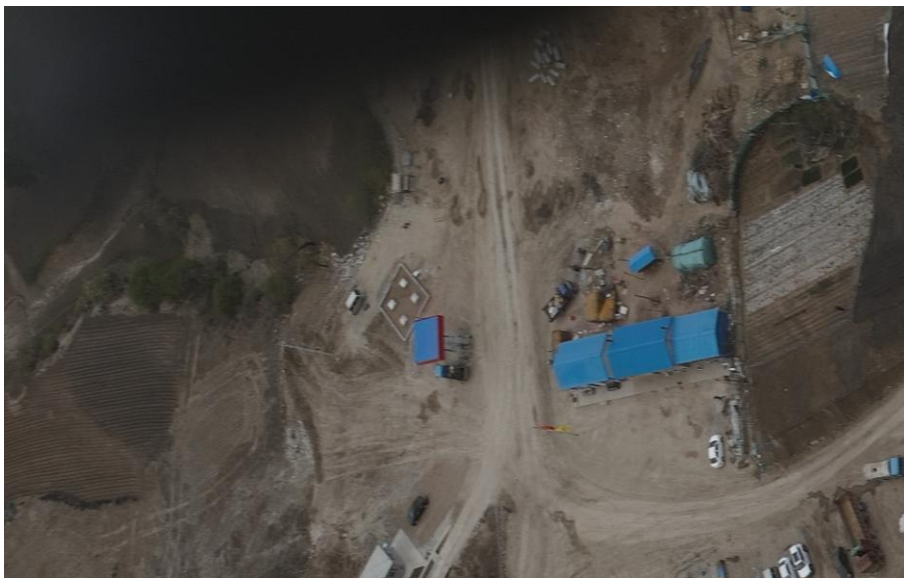
图 3-7 矿区办公生活区