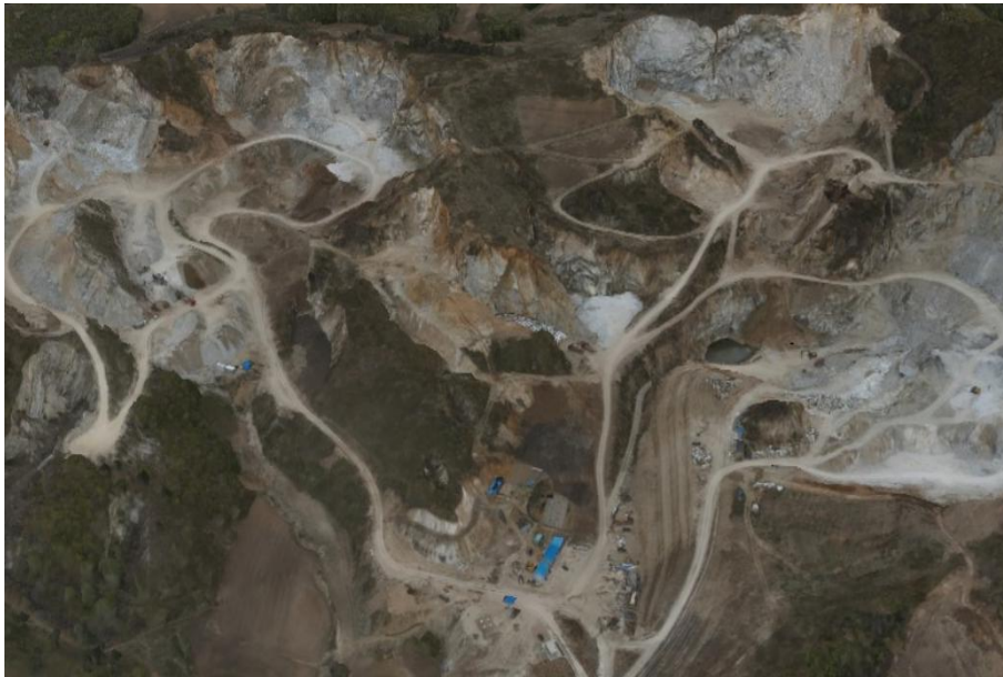
图 3-6 矿区道路