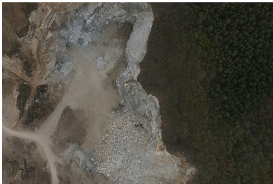
图 3-4 三采区采场