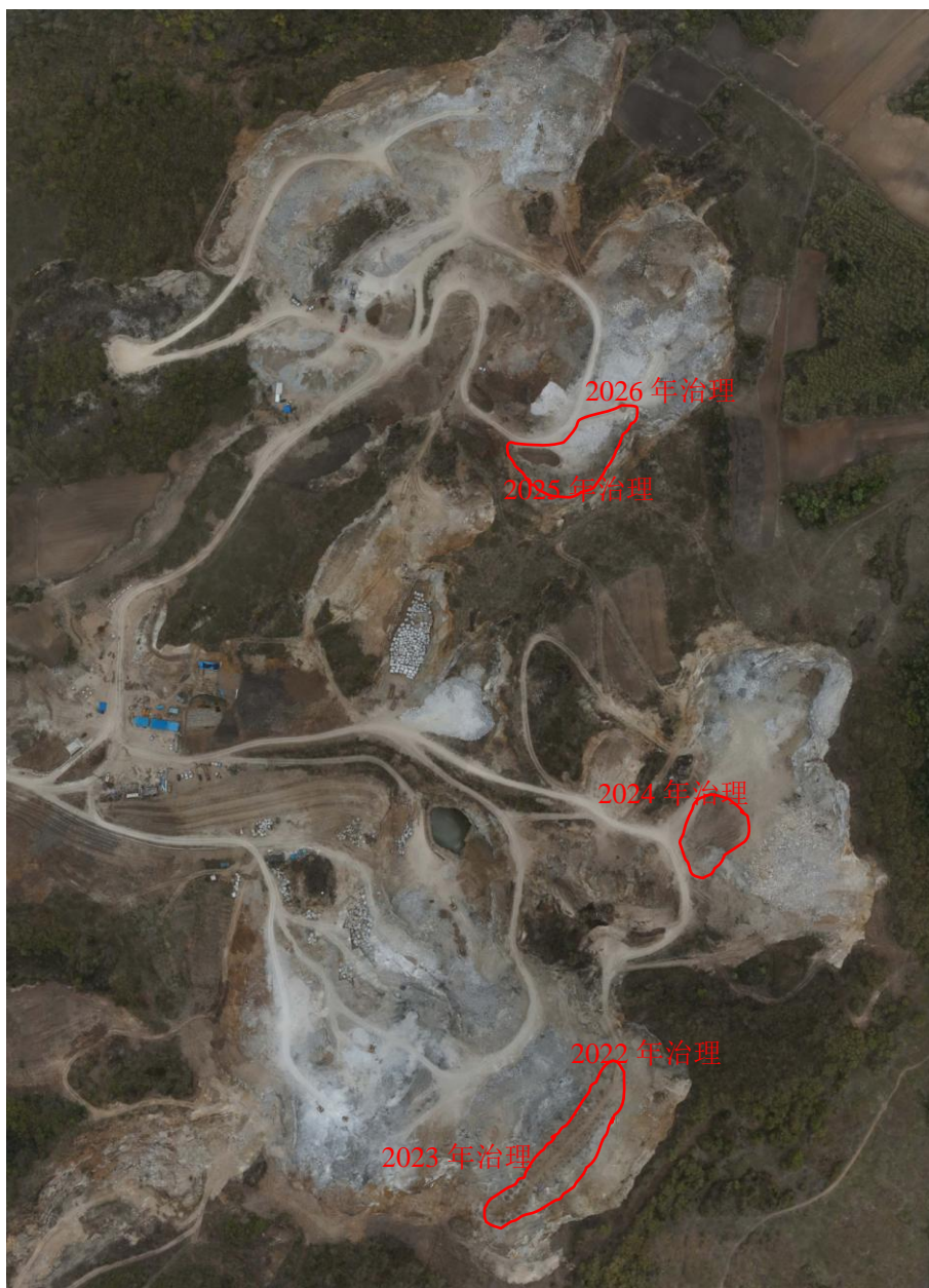
图 6-1 复垦区位置航飞影像图