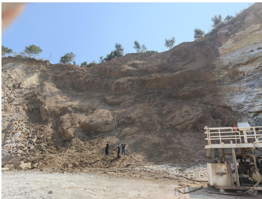
图 3-1 采场边坡照片

依据《编制规范》附表 E 矿山地质环境影响程度分级表，经现状评估综合确定地质灾害影响和破坏程度“较轻”。