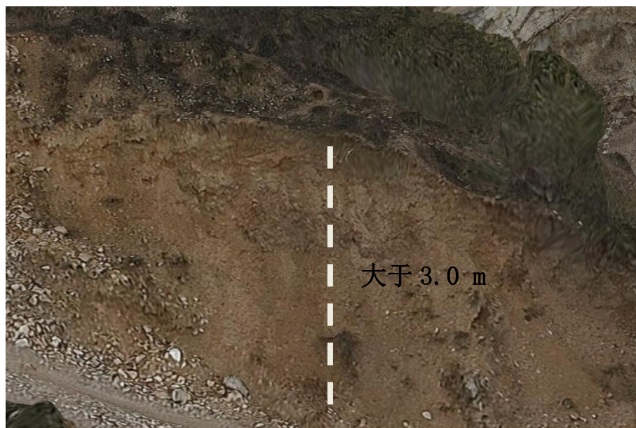
图 2-3 矿区土壤剖面图